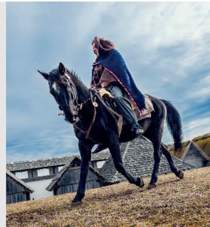
Reiterimpressionen im Freilichtmuseum Heuneburg