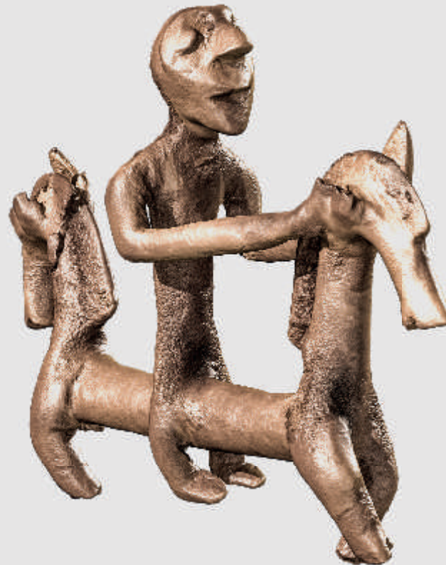
Computertomografische Darstellung des Unlinger Reiters

Im Freilichtmuseum Heuneburg-Pyrene und im Keltenmuseum Heuneburg in Herbertingen-Hundersingen erwarten den Besucher die Erstpräsentation der Originalfunde aus Unlingen und eine spannende Ausstellung zum Thema Reiten und Fahren bei den Kelten sowie ihren skythischen und griechischen Nachbarn. Doch was wäre eine solche Ausstellung ohne richtige Pferde und Reiter? Freuen Sie sich auf die Shows mit Pferden und Darstellern, die auf einer eigens eingerichteten Reitbahn auf der Heuneburg präsentiert werden!