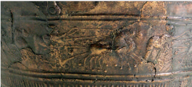
Berühmte Wagenlenkerszene auf der bronzenen Situla (Eimer) von Kuffern in Niederösterreich