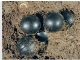
Goldener Schläfenring und fünf Gagatkugeln aus Hügel 1 von Unlingen