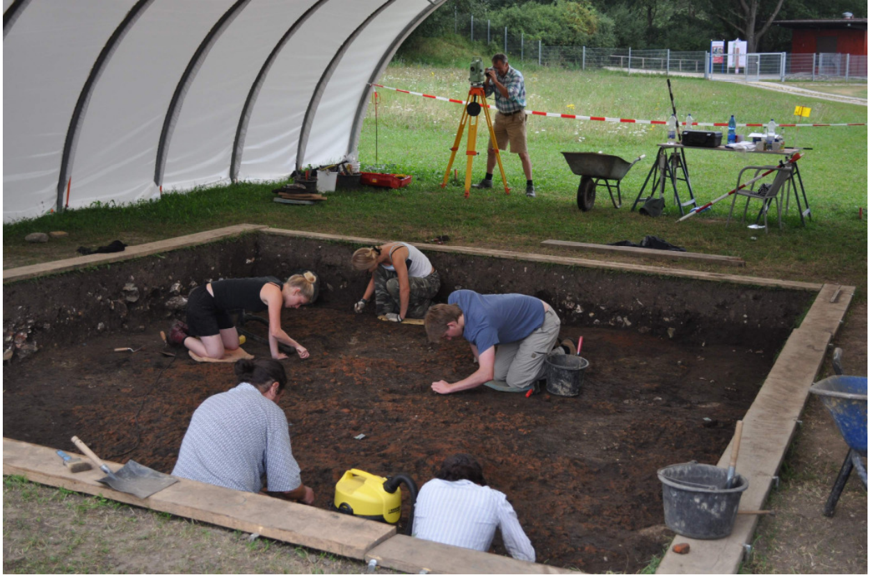
Abb. 2: Grabungssituation Hausbefund