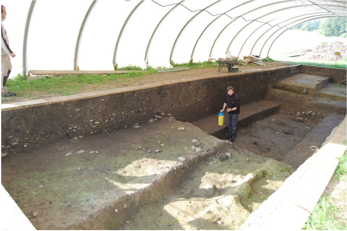
Abb. 3: Grabungssituation Graben